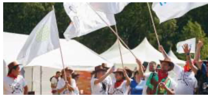
Фото- и видеорепортажи

X-Com, Группа компаний X-Com на XVII Слете системных администраторов 2022